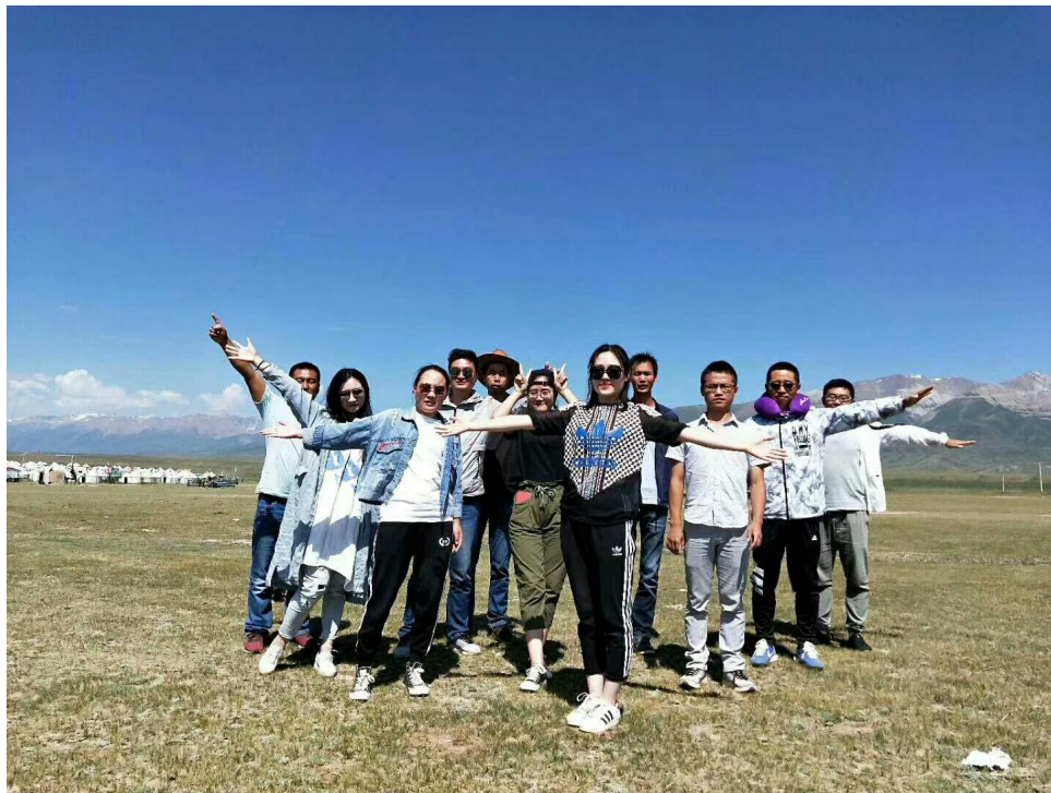
伊犁那拉提草原剪影